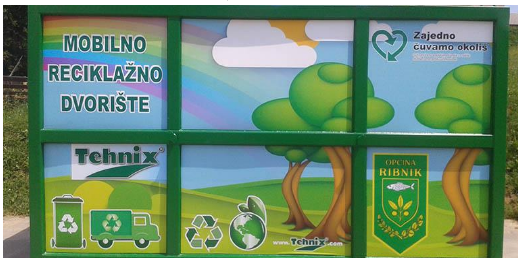
Slika 2: Mobilno reciklažno dvorište Općine Ribnik

Mobilno reciklažno dvorište je upisano u Očevidnik reciklažnih dvorišta pri Ministarstvu zaštite okoliša i energetike, pod brojem REC-55, na ime AZELIJA EKO d.o.o.